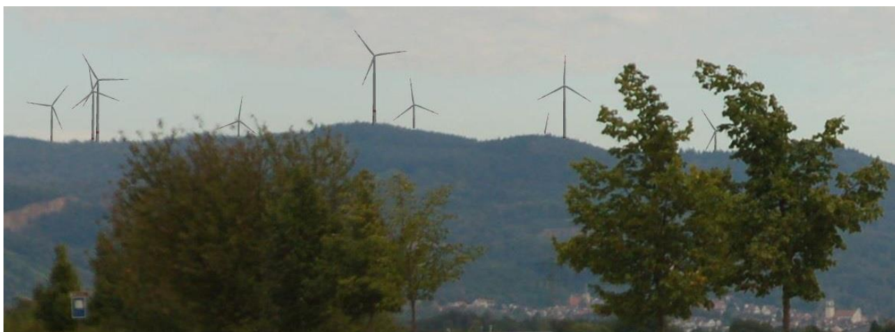
Fotomontage möglicher Standorte von Windkraftanlagen gemäß aktuellem Planungsstand, Sicht auf Dossenheim von Ladenburg