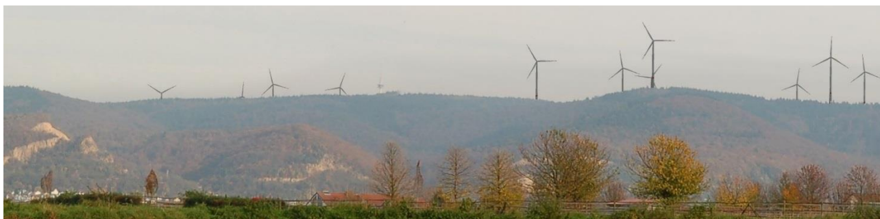
Fotomontage möglicher Standorte von Windkraftanlagen gemäß aktuellem Planungsstand, Sicht auf Dossenheim von Edingen-Neckarhausen